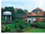
P.S. Varier Museum at Kottakkal