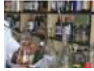
Quality control laboratory