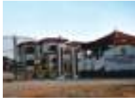
Factory at Nanjangud