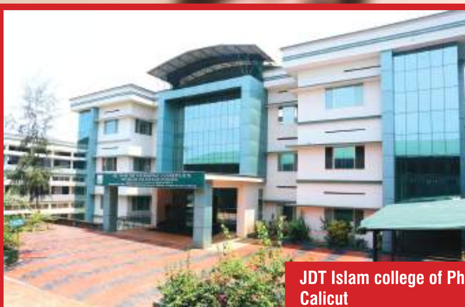
JDT Islam college of Pharmacy (JICP) Calicut

M any Self financing Pharmacy Colleges imparting Pharmacy education from Diploma level to Post graduate levels are functioning in North Kerala with high Academic excellence and infrastructure to contain the stringent educational regulations. One among them having more than 24 years tradition in Pharmacy education is JDT Islam College of Pharmacy.