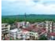
Factory complex at Kottakkal