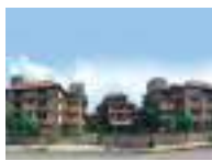
Hospital at Delhi