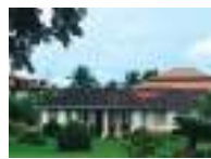
Centre for Medicinal Plants Research