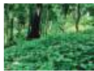
Medicinal plant estate