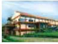
Factory at Kanjikode