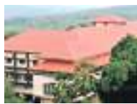
Charitable Hospital at Kottakkal