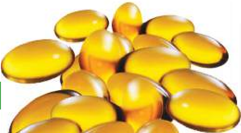
ന്യൂട്രാജൻ ഫാർമ പ്രൈവറ്റ് ലിമിറ്റഡ്, തിരുവനന്തപുരം

2005 ൽ തിരുവനന്തപുരത്തു പാപ്പനംകോട് ഇൻഡസ്ട്രിയൽ എസ്റ്റേറ്റിൽ അന്താരാഷ്ട്ര നിലവാരത്തിൽ സ്ഥാപിതമായ ഒരു സോഫ്റ്റ് ജലാറ്റിൻ ക്യാപ്സ്യൂൾ മരുന്നു നിർമ്മാണശാലയാണ് ന്യൂട്രാജൻ ഫാർമ . ഇവിടെ പ്രധാനമായും കോൺട്രാക്ട് മാനുഫാക്ചറിങ് ആണുള്ളത്. ഫാർമസ്യൂട്ടിക്കൽ, ന്യൂട്രാസ്യൂട്ടിക്കൽ വിഭാഗത്തിൽപ്പെടുന്ന എല്ലാ വസ്തുക്കളും ഇവിടെ ഗുണമേന്മയോടെ ഉൽപ്പാദിപ്പിക്കുന്നു. വിതരണക്കാരുടെ ആവശ്യാനുസരണം അവരുടെ ബ്രാൻഡിൽ, അംഗീകൃത ഫോർമുലയിൽ, ഇഷ്യുപ്പെട്ട പാക്കിങ്ങിൽ കുപ്പിയിലോ, ബ്ലിസ്റ്റർ പാക്കിങ്ങിലോ ആവശ്യാനുസരണം ക്യാപ്സ്യൂളുകൾ നിർമ്മിച്ചു നൽകുന്നു.