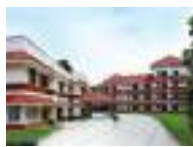
Hospital at Kochi