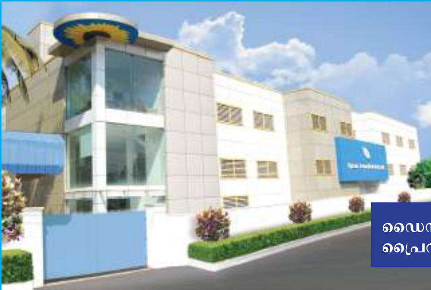
ഡൈനാമിക് ടെക്നോ മെഡിക്കൽസ് പ്രൈവറ്റ് ലിമിറ്റഡ് (DTML), ആലുവ

കേ രളത്തിലെ ഏറ്റവും വലിയ ഓർത്തോപീഡിക് ഉപകരണ നിർമ്മാതാക്കളാണ് എറണാകുളം ജില്ലയിൽ ആലുവയിലെ അശോകപുരത്തു പ്രവർത്തിക്കുന്ന ഡൈനാമിക് ടെക്നോ മെഡിക്കൽസ് എന്ന സ്ഥാപനം. ഇക്കഴിഞ്ഞ നാലു പതിറ്റാണ്ടുകളായി ഇന്ത്യയിലും വിദേശത്തും ഗുണമേന്മയുള്ള ഓർത്തോപീഡിക് ഉപകരണങ്ങളും അനുബന്ധ വസ്തുക്കളും നിർമ്മിച്ച് വിതരണം ചെയ്യുന്ന സ്ഥാപനമായി ഇത് മാറിയിരിക്കുന്നു. ഇന്ന് പത്തോളം നിർമ്മാണ സ്ഥാപനങ്ങളും 1600 നു മുകളിൽ ജീവനക്കാരും രണ്ടായിരത്തിലധികം വിതരണക്കാരുമുള്ള ഈ അത്യാധുനിക സ്ഥാപന ഗ്രൂപ്പ്, 40 രാജ്യങ്ങളിലേക്ക് തങ്ങളുടെ ഉൽപ്പന്നങ്ങൾ കയറ്റുമതി ചെയ്യുന്നു. FDA അംഗീകാരം, CE സർട്ടിഫിക്കറ്റ്, ISO 9001 :2008, 13485 2006, GMP സർട്ടിഫിക്കറ്റ് തുടങ്ങി എല്ലാ ആധുനിക ഗുണമേന്മ അംഗീകാരങ്ങളുമുള്ള ഈ സ്ഥാപനത്തിൽ അനുഭവമുക്തമാക്കിയ വസ്തുക്കളും നിർമ്മിക്കുന്നു.