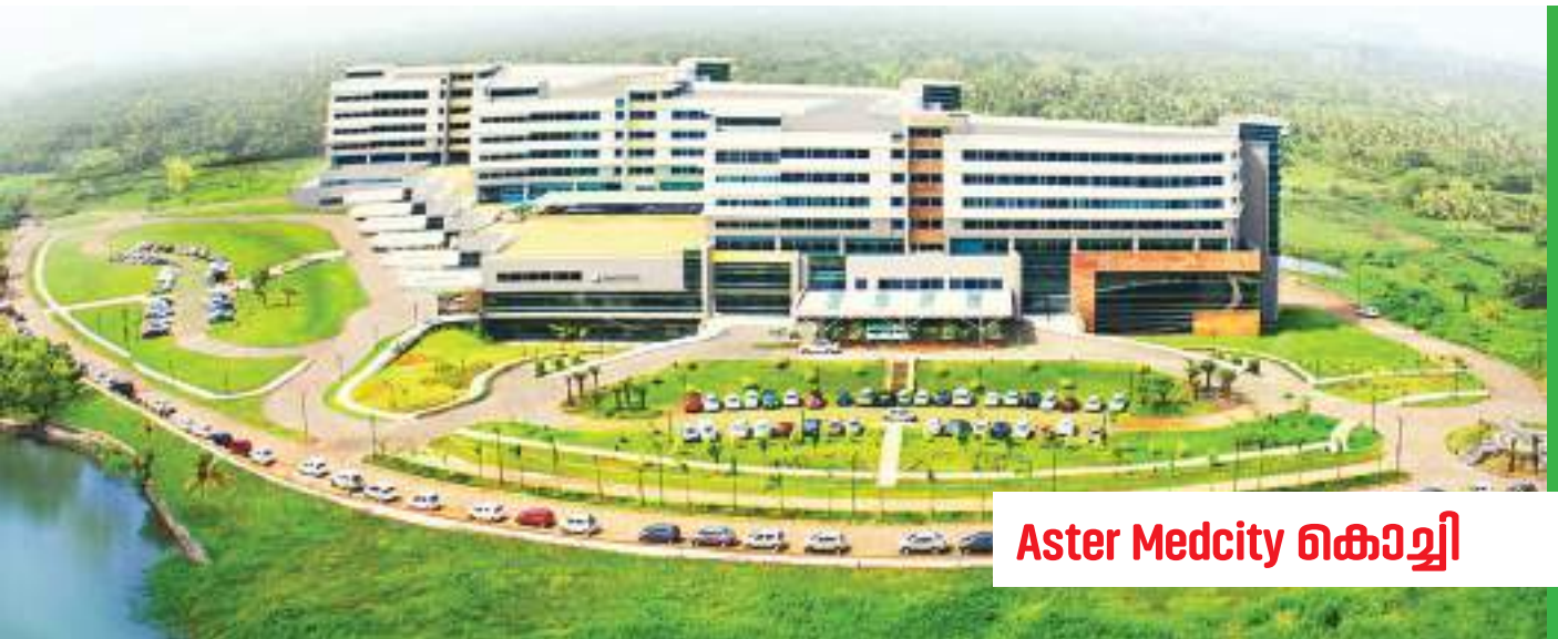
Aster Medcity കൊച്ചി

We 'll treat you well എന്ന ആപ്തവാക്യവുമായി ലോകമെമ്പാടും 9 രാജ്യങ്ങളിൽ 323 മെഡിക്കൽ സ്ഥാപനങ്ങൾ സ്വന്തമായുള്ള Aster DM Healthcare ന്റെ കേരളത്തിലെ അഭിമാന സ്ഥാപനമാണ് Aster Medcity കൊച്ചി. പത്മശ്രീ ഡോ.ആസാദ് മുപ്പൻ എന്ന ഭിഷഗ്വരന്റെ ലോകത്തിനുള്ള സമ്മാനമാണ് ഈ സ്ഥാപനം. മായോ ക്ലിനിക് എന്ന പ്രശസ്ത ആശുപത്രിയുടെ മാതൃകയിൽ ആധുനിക ചികിത്സ കേരളത്തിൽ ലഭ്യമാക്കുക എന്ന തന്റെ സ്വപ്നം ഡോ.ആസാദ് മുപ്പൻ ഈ ആശുപത്രിയിലൂടെ സാക്ഷാത്കരിക്കുന്നു. ഇന്ത്യയിൽ മാത്രമല്ല വിദേശരാജ്യങ്ങളിലും ഉള്ളവർക്ക് ഇവിടുത്തെ അത്യാധുനിക സംവിധാനങ്ങൾ പ്രയോജനകരമായി തീർന്നിരിക്കുന്നു. Aster Medcity Hcp medical township ആയി മാറിയിരിക്കുന്നു. ഒരു Core Hospital ഉം വിവിധ Centers of Excellence (CoEs) ഉം ചേർന്ന ഈ ബുഹർസ്ഥാപനം, ചികിത്സയോടൊപ്പം തന്നെ രോഗി പരിചരണത്തിനും പ്രാധാന്യം നൽകുന്നു. കൊച്ചി നഗരത്തിന്റെ തിരക്കുകളിൽ നിന്നും മാറി ചേരാനല്ലൂർ എന്ന സ്ഥലത്തെ ഗ്രാമീണ അന്തരീക്ഷത്തിലാണ് കൊച്ചി അന്താരാഷ്ട്ര വിമാനത്താവളത്തിൽ നിന്നും അധികം ദൂരെയല്ലാതെ ഈ ആശുപത്രി സ്ഥാപിച്ചിരിക്കുന്നത്. ഇന്ത്യയിലും വിദേശത്തുമുള്ള കഴിവുറ്റ ഡോക്ടർമാരും ആരോഗ്യ വിദഗ്ധരും ഇവിടെ സേവനമനുഷ്ഠിക്കുന്നു. സൂപ്പർ സ്പെഷ്യാലിറ്റി വകുപ്പുകൾക്ക് പുറമെ ആധുനിക സംവിധാനത്തോടെയുള്ള വിവിധ അനുബന്ധ സേവനങ്ങളായ Emergency Services, Intensive Care Units, Operation Theatres, Minimal Access Robotic Surgery, Rehabilitation, Diagnostics & Blood Bank, Pharmacy, Clinical Nutrition & Dietetics എന്നിവ ഇവിടെയുണ്ട്.