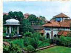
P.S. Varier Museum at Kottakkal