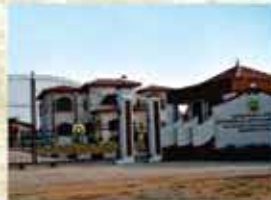
Factory at Nanjangud