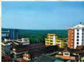
Hospital complex at Kottakkal