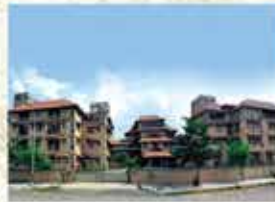
Hospital at Delhi