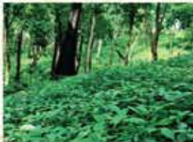
Medicinal plant estate