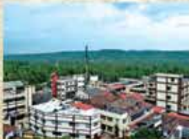
Factory complex at Kottakkal