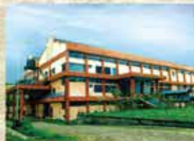
Factory at Kanjikode