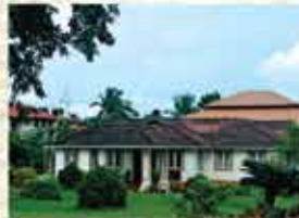
Centre for Medicinal Plants Research