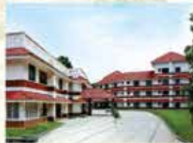
Hospital at Kochi