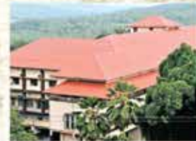
Charitable Hospital at Kottakkal