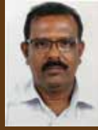
ബേബി പി.യു. കാമയേനു