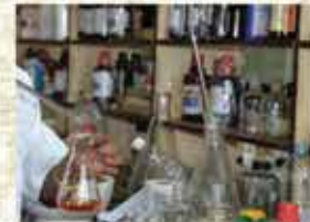
Quality control laboratory